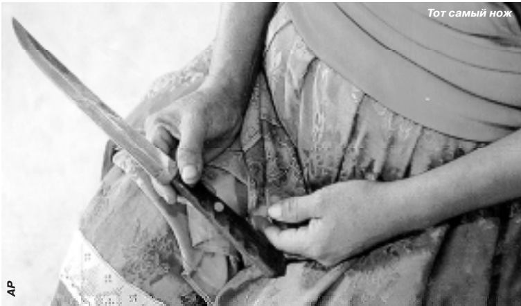
Тот самый нож